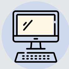
MÁY TÍNH CÓ CAMERA